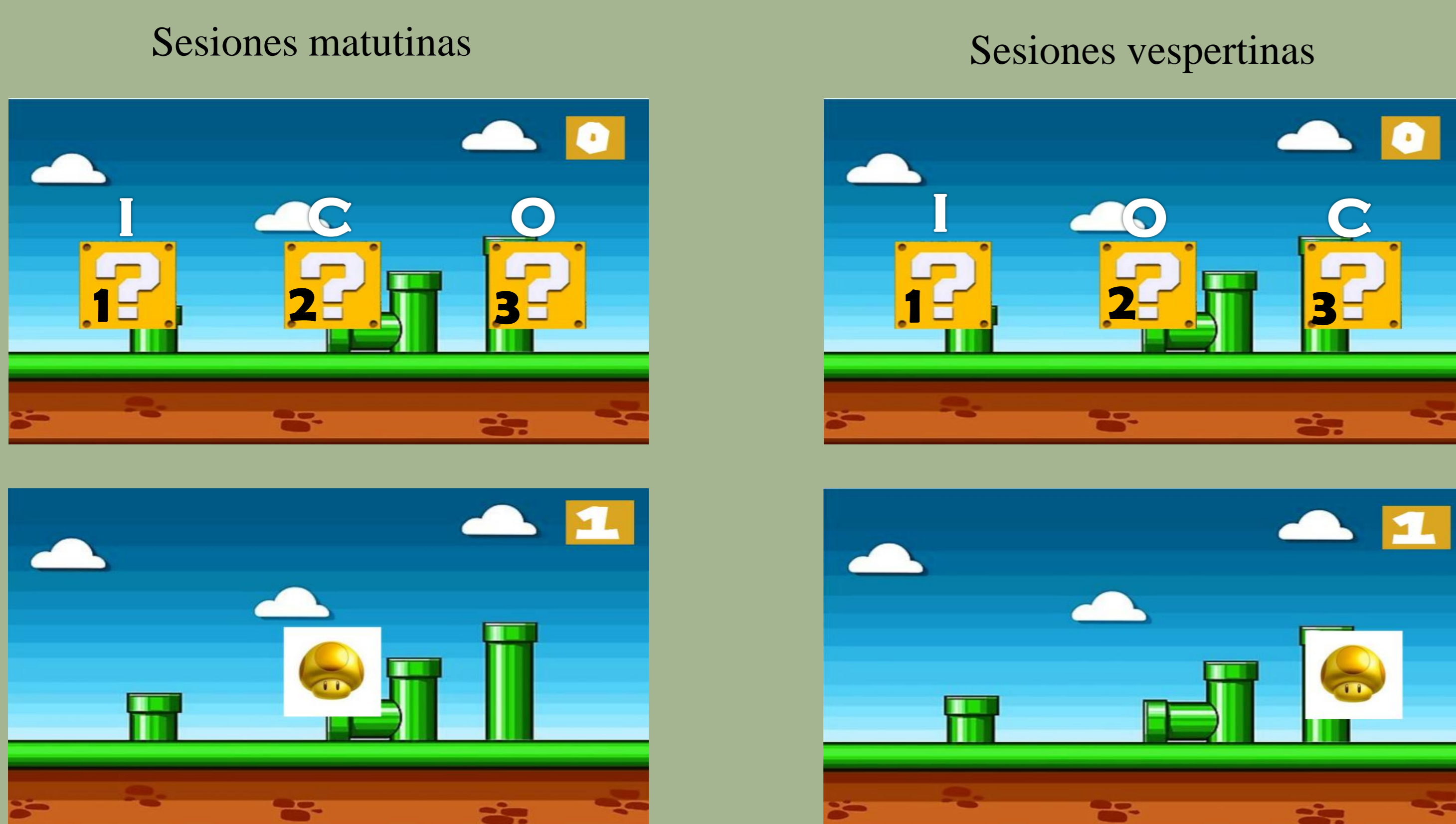
Figura 1. Ejemplo de tarea experimental.